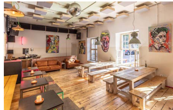
kavárny a bary