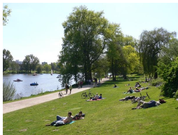
park u jezera Aasee