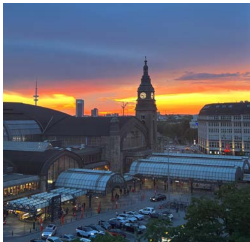
výlet do Hamburгу